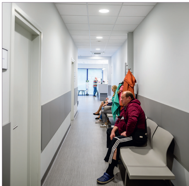
Šviesūs ir patogūs laukiamieji.

Svarbiausias klinikos vadovės siekis – šeimos medicinos stiprinimas, nes būtent ši institucija yra visos Lietuvos medicinos pamatas, galintis užtikrinti sveiką, darbingą ir laimingą visuomenę.