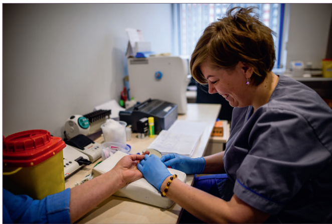
Klientų patogumui tyrimų mėginiai imami klinikoje.